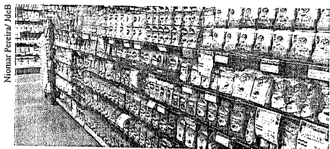
Café foi o produto com maior variação positiva no ano passado em Francisco Beltrão: +50,80%.

No acumulado do ano de 2021, o valor da cesta básica apresentou aumento de custo em Dois Vizinhos (10,58%); Francisco Beltrão (5,34%) e, em Pato Branco (8,42%).