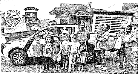
Policiais fardados e viaturas foram atrações em festa, que reuniu também crianças amigas do aniversariante.

A família do aniversariante entrou em contato com a polícia militar informando da admiração do menino pela atividade policial e do sonho em seguir esta profis-